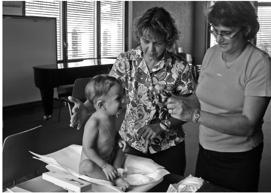
Le travail de la puéricultrice ne se limite pas à prendre la température. Dommage que certains politiciens ne le savent pas.

Le travail de l'infirmière puéricultrice est encore mal connu, non seulement par la population mais, plus gênant encore, par certains élus, communaux notamment, qui rechignent à subventionner un service de prévention qui pourtant conseille et aide un nombre important de familles et de mamans élevant seules leurs enfants.